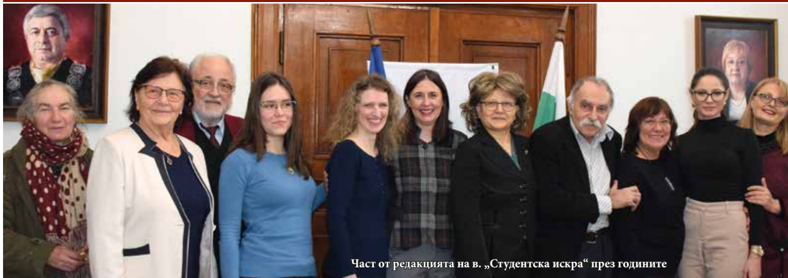
Част от редакцията на в. „Студентска искра“ през годините

На 5 февруари 2023 г. вестникът на Русенския университет „Студентска искра“ отпразнува своята 65-годишнина с Кръгла маса, посветена на всички отдала знания, време и любов за изданието, на всички редактори и редакции, на всички читатели.